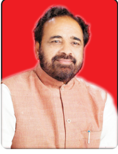
गोपाल भार्गव मंत्री, सामाजिक न्याय, पंचायत एवं ग्रामीण विकास तथा सहकारिता मध्यप्रदेश शासन